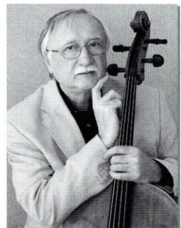
ミロスラフ・ペトラージュ Miroslav Petras

プラハ芸術アカデミー及びプラハ音楽院教授。長年にわたって「ザ チェコトリオ」のメンバーであったサシ・ヴェチトモフに師事。「プラハの春」国際音楽祭において桂冠賞を受賞、国立コンクールではベートーヴェン・コンクールの勝者などの実績をもつ。プラハ交響楽団(FOK)の首席奏者となった彼は、オーケストラ活動のほか同交響楽団の公式ソリストを長年にわたり務め、ヨーロッパ全土、南北アメリカ、日本、台湾などに足跡を残した。