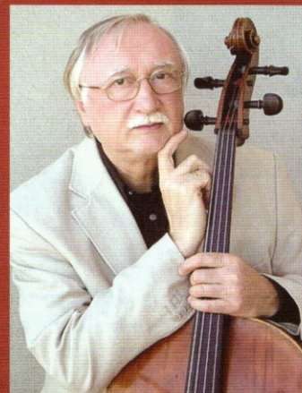
ミロスラフ・ペトラージュ (チェロ) Miroslav Petras ブラハ芸術アカデミー教授/ブラハ音楽院教授